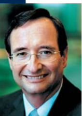
INTERVIEW MIT Christoph Leitl